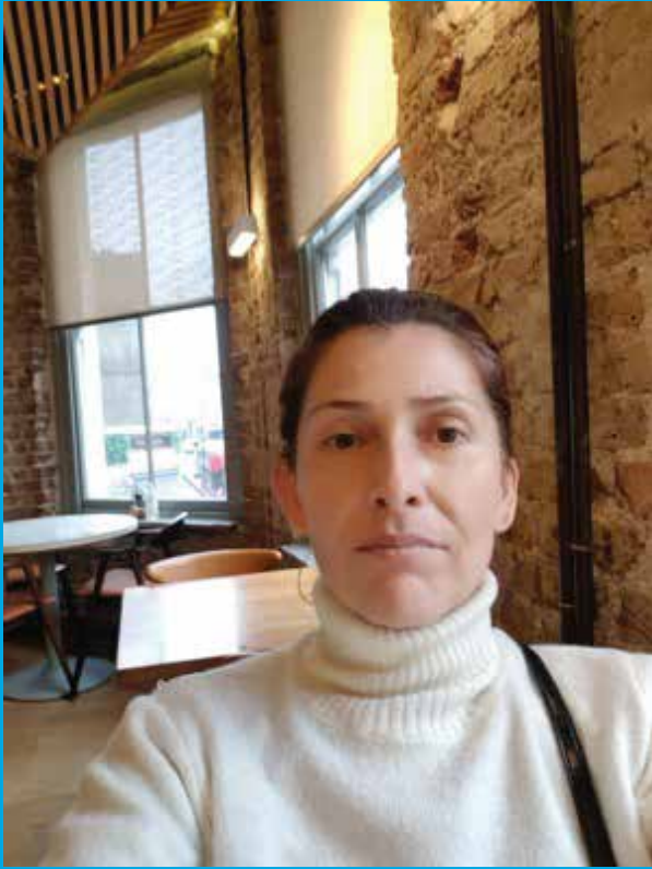
Por: Dina Donoso.

Me gustaría partir de la premisa que cada ser humano es individual y como tal no hay una fórmula mágica que nos haga cambiar o ver las cosas diferentes de la noche a la mañana. Sin embargo, sí que desde una visión adulta podemos dejar creencias y patrones infantiles que nos han condicionado o marcado nuestra forma de actuar y de pensar. Aunque la teoría es más fácil que la práctica, comprobamos que desde la experimentación y del ejemplo de muchas mujeres nos daremos cuenta que sí se puede.