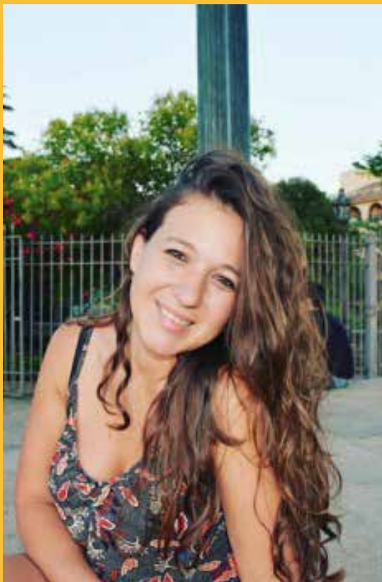
Por: Mayka Ortega.

Ser parte de FEWP y colaborar con la organización como voluntaria está siendo una experiencia muy gratificante. A través de la organización, las personas consiguen un desarrollo personal, social y cultural. Los distintos grupos proporcionan un ambiente cercano donde todos tienen la oportunidad de abrirse emocionalmente, compartir sus experiencias y hacer preguntas; algo que es esencial para mejorar la salud emocional de las personas.