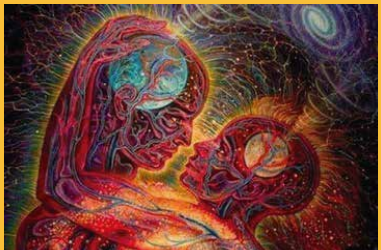
Por: Martha Nubia Beltran Guerrero.

Es para mi un honor ser parte de esta organización en pro de los hispano hablantes, que no conoce fronteras ni nacionalidades. Desde mi corazón gracias por el respeto y el cariño..