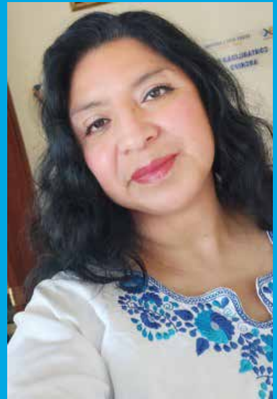
Por: Lourdes Urbano.

Gracias. Family Emotional Wellbeing Project.