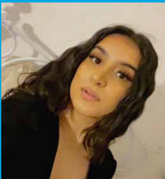
Por: Adan Saleh.

Reconociendo esta labor solidaria del proyecto y Marisol, desearía que haya más Marisoles para tener un mundo mejor.