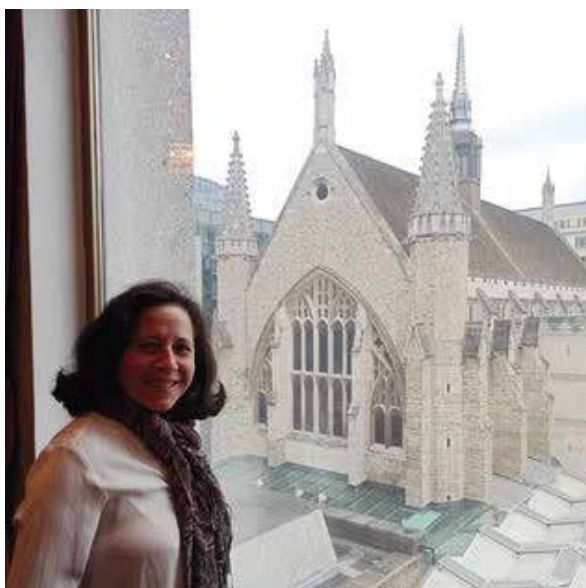
Por: Margot Ramirez.

Siempre cuando tenemos la suerte de encontrar a alguien que no solo ve por su persona, sino por todo el conjunto de personas en especial de las mujeres, somos afortunadas. Mi experiencia en este grupo de mujeres ha sido especial desde el primer día. Aquí pude conocer a mujeres valiosas con las que pudimos realizar algunos sueños que teníamos en común. El viajar con amigas y participar de miles de aventuras juntas ha sido una de las más gratas experiencias de mi vida. El participar como integrante y colaboradora en este gran proyecto es para mí una realización personal, el apoyo emocional que tenemos entre todas las integrantes nos ha hecho crecer y renovarse como mujeres empoderadas y emprendedoras para poder cambiar nuestra mentalidad. Gracias Family Emotional Wellbeing por todo lo que hace por todo el grupo humano extranjero que vivimos en esta ciudad.