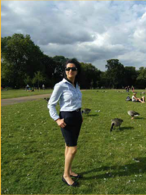
Por: Jenny Aguirre .

Agradecida con Family Emotional wellbeing Project por el gran aporte brindado, ha sido muy valioso y beneficioso tanto para mi como para todos los miembros que conformaron el grupo de Arteterapia, el mismo que de manera voluntaria tuve el orgullo y el gusto de liderar, gracias por su apoyo, comprensión, solidaridad e integración, por darme la oportunidad y abrirme las puertas desde hace más de un año, el mismo que estuvo lleno de mucho aprendizaje, autoconocimiento, expresión emocional y desarrollo personal.