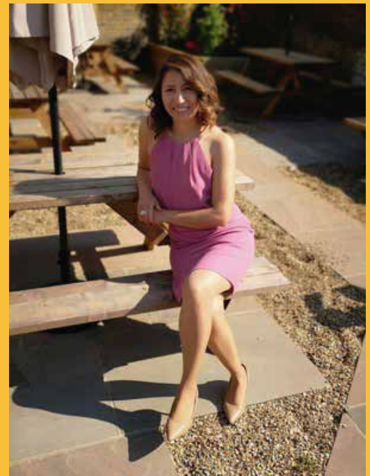
Por: Zaira Granda.

Una vez más gracias y que sigan adelante, cuenten conmigo.